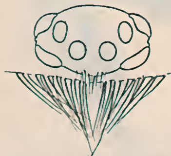
Fig. 5 Butantania hirsuta , g. n., sp. n. Olhos

Butantania hirsuta , sp. n. (Figs. 5 a 8).